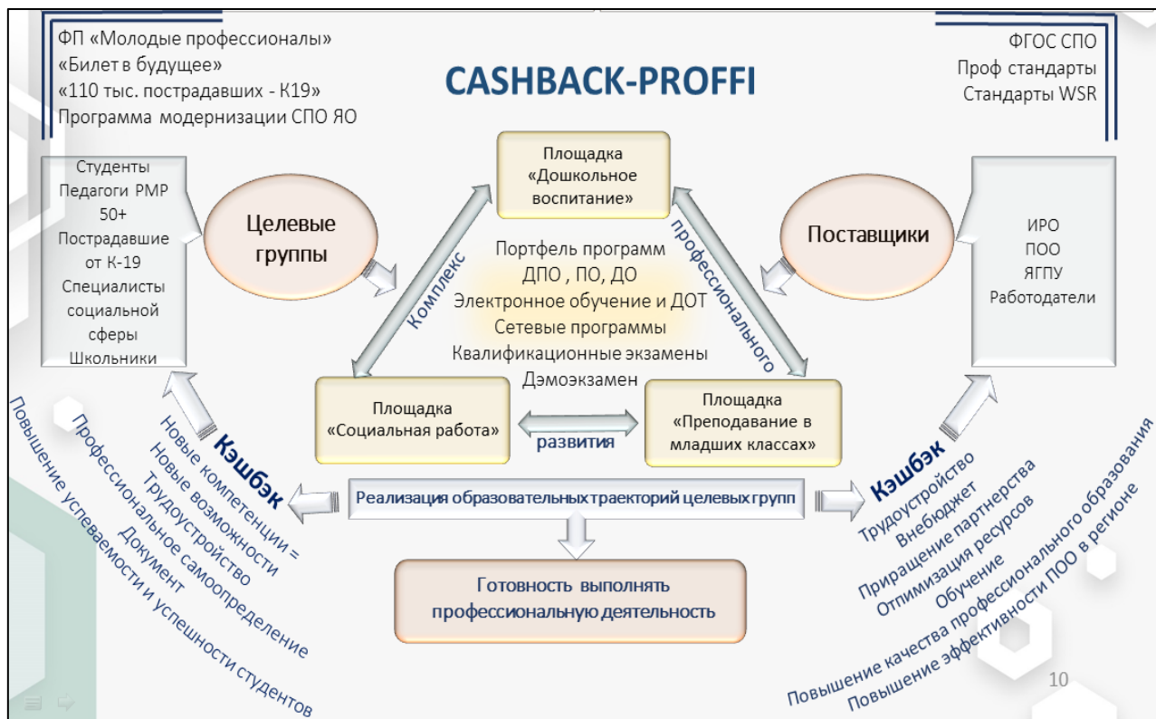
Рисунок 5. Модель функционирования проекта 3

Модель функционирования проекта «Создание в ГПОУ ЯО Ростовском педагогическом колледже комплекса профессионального развития CASHBACK-PROFFI» представлена на рисунке 5.