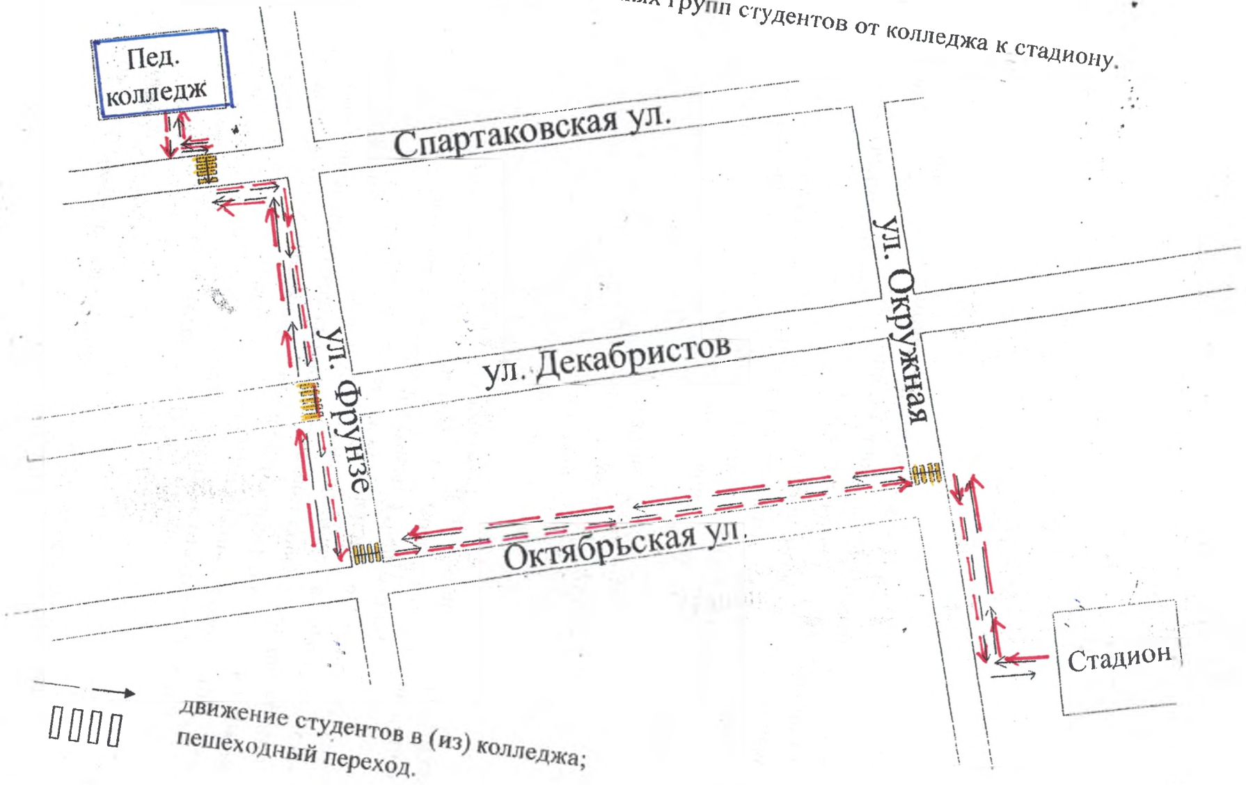
1.3. План-схема маршрута движения организованных групп студентов от колледжа к стадиону.